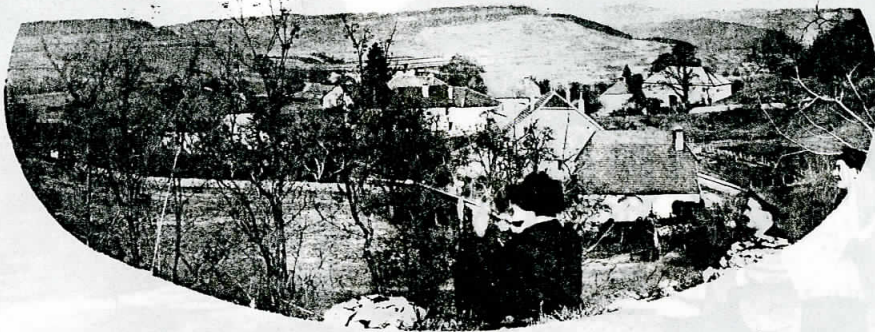
CHATELNEUF — Bas du Village