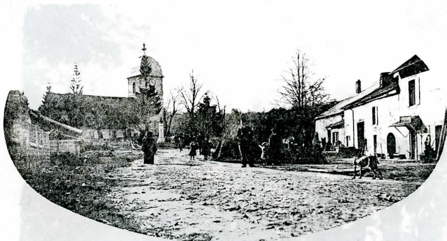
CHATELNEUF — Église et Café Vannoz

Le Bas du Village, vu depuis la Roche du Bugenet. C'était sans doute, lors de la "passe aux pigeons".