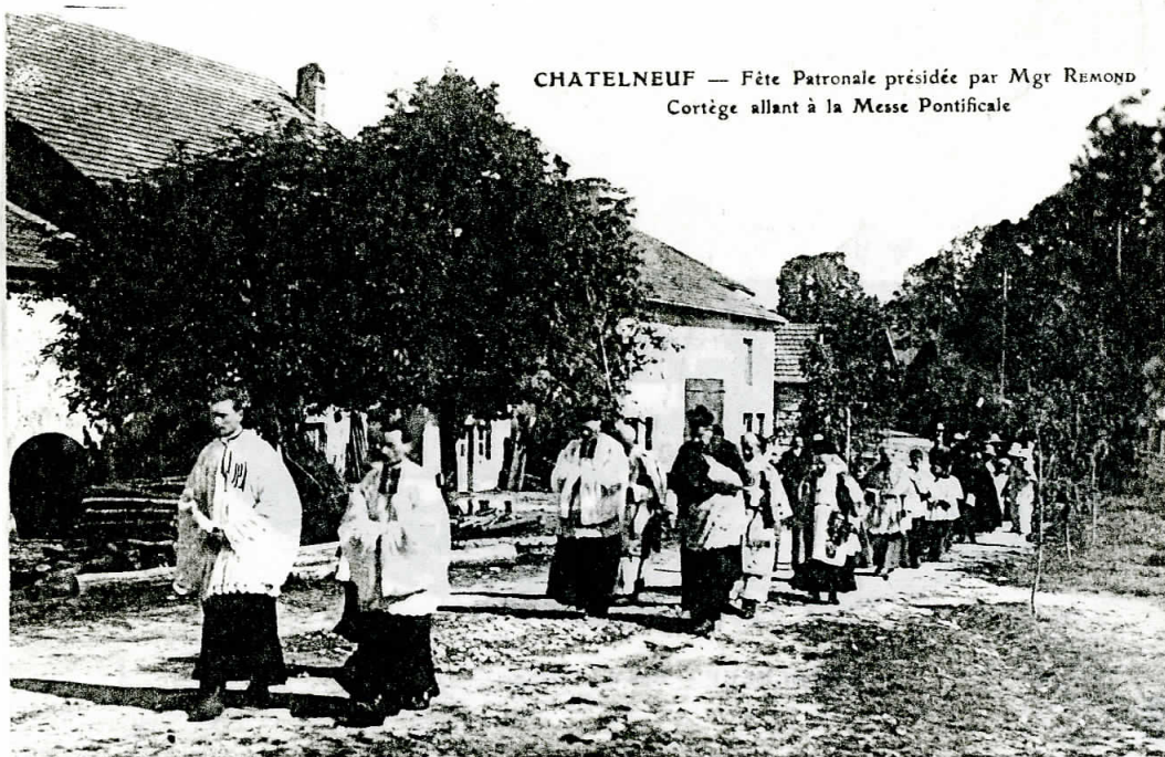
CHATELNEUF — Fête Patronale présidée par Mgr REMOND Cortège allant à la Messe Pontificale

1923 - Que de verdure ! on a même, pour la circonstance, planté des branches ou des arbustes sur le parcours de la procession. Cela se pratique encore dans certains villages pour les mariages.